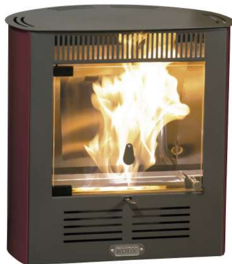
RUBY SMART BURDEOS 9692571

Apto para calentar un ambiente pequeño. Quemador regulable con fibra cerámica. SIN INSTALACION. SIN CONDUCTO DE EVACUACIÓN DE HUMO. 2300W. Capacidad calefacción 70m3. Consumo bioetanol 0.30l/h. Depósito 1.5lt. Autonomía +/-6h. Medidas 52,5x47x36cm 17kgs. 2años garantía. Con ventilación.