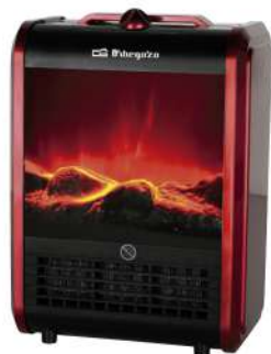
CHIMENA ELÉCTRICA ORBEGOZO 9645027

750/1500W. Luz Led. Resistencia cerámica PTC. 24 x 34 x 16cm.