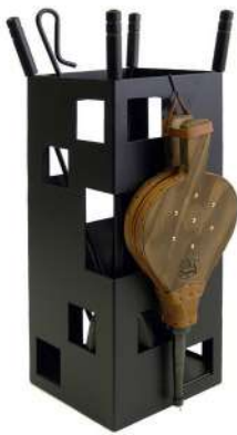
5 PIEZAS 50CM 9692513 Moderno, 5. Cuadrado. 4 útiles negros y fuelle. Práctico y moderno. 50x20x20cm.

DISPONEMOS DE UN AMPLIO SURTIDO EN ACCESORIOS PARA CHIMENEA CONSULTE EN SU FERRETERÍA