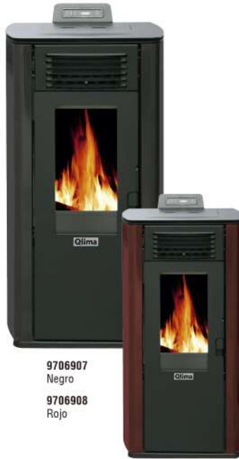
9706907 Negro 9706908 Rojo