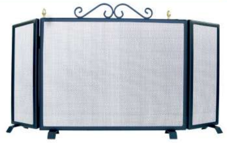
SALVACHISPAS PLEGABLE DE CHIMENEA 9605883 Con dos hojas plegables, para adaptar a muchas medidas de chimenea, ya que el sistema que lleva de patas se adapta muy bien al suelo y protege para que el fuego no salga para el exterior sin quitar calor ninguna. 110x11x60cm.