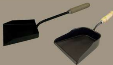
PALA METÁLICA RECOGE CENIZAS Con puño de madera largo. Para chimeneas de leña, y estufas de pellet y carbón, que nos facilitara la extracción de cenizas.

9687762 9678420 6.5x17.5x47.5cm. 24x23cm.