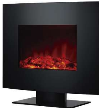
CHIMENA ELÉCTRICA CON PIE Y FRONTAL CURVO 9702535

Medidas: 66x15,5x52 cm Potencia máxima: 2000W. Termostato de temperatura de 15° a 30°C. Programación semanal de funcionamiento. Función detección de ventana abierta. Calor por convección. Panel frontal curvo de cristal templado color negro. Protección contra sobrecalentamiento. Efecto llamas reales por led, ajustables. Mando a distancia. Instalación con pie o mural.