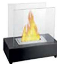
BIOCHIMENA DE SOBREMESA/SUELO 9706929

Gran base rectangular en acero lacado negro. Quemador rectangular de 1L con fibras cerámicas. Ajuste de llama, doble pared de protección en vidrio de alta resistencia. Gran llama.