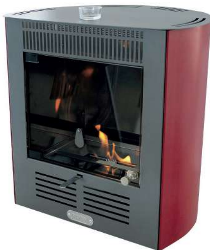
ESTUFA BIOETANOL 9706924

Estufa de bioetanol con acabados de máxima calidad. 2300W. Sin instalación, sin humos y sin la necesidad de encendido eléctrico. El exterior no se calienta. Quemador regulable. Con bomba de trasvase, patas regulables y recipiente porta esencias. Capacidad de calefacción de 70 m3 Estructura de acero barnizado y cristal, con 1,5l de capacidad de depósito y un consumo de 300ml/hora. 2 años de garantía y ampliación de 1 año usando Ethaline.