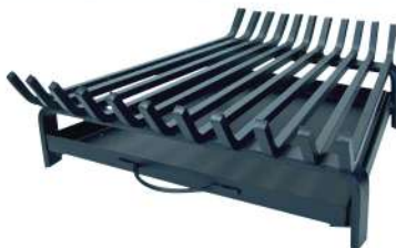
PARRILLA CHIMENEA 7289043 Parrilla para la chimenea con cajón recoge cenizas de forma trapezoidal. Con los frontales de los barrotes doblados para que no se caigan los leños. La parte más pequeña mide 45cm. 60 x 43 x 16cm.