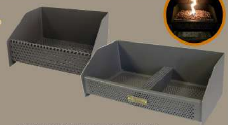
CESTA QUEMADOR DE PELLETS Pintado con pintura anticorrosiva hasta 800°. Esta diseñada para ser utilizada en estufas de leña de manera que se pueda crear ambientes cálidos y agradables.

9687760 9687761 30x17x25cm. Doble. 49x17x25cm.