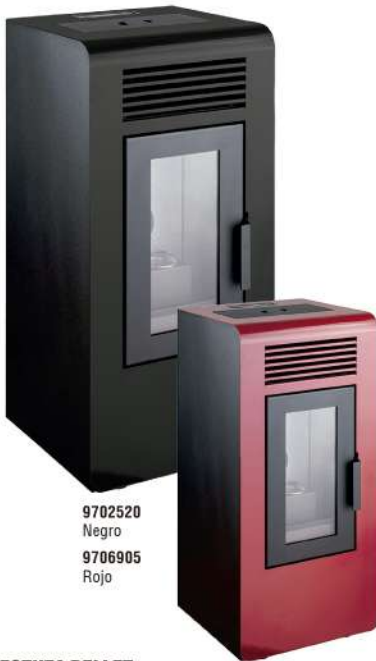
9702520 Negro 9706905 Rojo