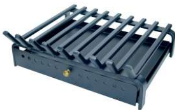
PARRILLA PARA LA CHIMENEA 9159426 Con cajón recoge cenizas, y el frontal de los barrotes doblados para que no se caigan los leños. Pintada en epoxi negro mate y secado al horno 300°. 60x17x45cm.