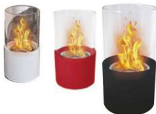
BIOCHIMENA DE SOBREMESA

Base redonda en acero lacado. Quemador cilíndrico de 300ml con fibras cerámicas. Pared de protección de vidrio.