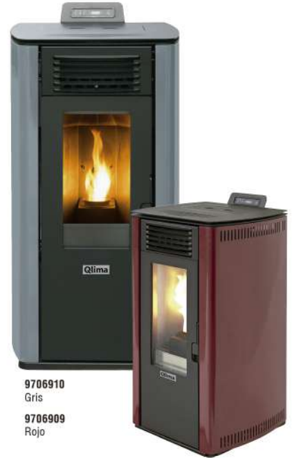
9706910 Gris 9706909 Rojo