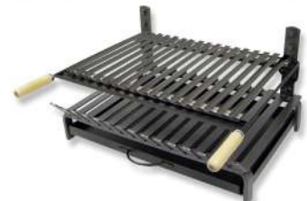
PARRILLA BARBACOA DE OBRA 9661828 Con pintura anticorrosiva que aguanta hasta 800 °C. Ideal para acoplar a barbacoas de piedra. Se puede utilizar tanto leña como carbón vegetal. 60x33x43cm.