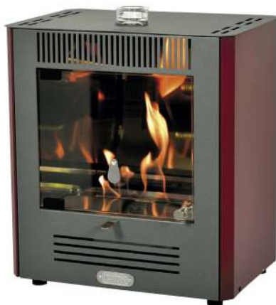
ESTUFA BIOETANOL 9706922

Estufa de bioetanol con acabados de máxima calidad. 2300W. Sin instalación, sin humos y sin la necesidad de encendido eléctrico. El exterior no se calienta. Quemador regulable. Estructura de acero barnizado y cristal, con 1,5l de capacidad de depósito y un consumo de 300ml/hora. 2 años de garantía y ampliación de 1 año usando Ethaline..