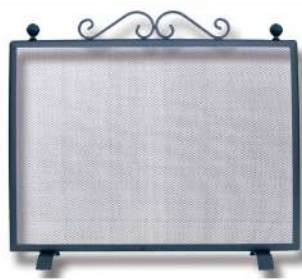
SALVACHISPAS SIMPLE DE CHIMENEA 9159628 El sistema que lleva de patas se adapta muy bien al suelo y protege para que el fuego no salga para el exterior sin quitar calor ninguna. 67x11x60cm.